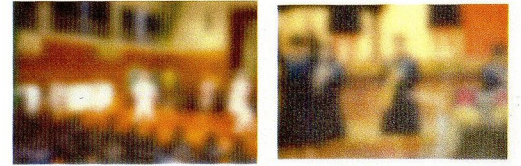
部活動紹介の様子

みなさんが、自分で好きで選んだ部活で、少々の困難にくじけずがんばって、自分を精一杯輝かせてくれることを期待します。1年生の皆さんは、先生や先輩の教えをよく聞き、先輩のプレーや動きをよく観察して、早く部活動に慣れましょう。チーム、自分の目標を確認し、心と技を磨きながら、日々、「成長している自分」を実感できる部活動に取り組んでいきましょう。