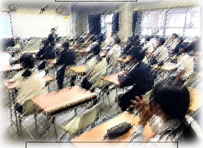
常葉高校出前授業