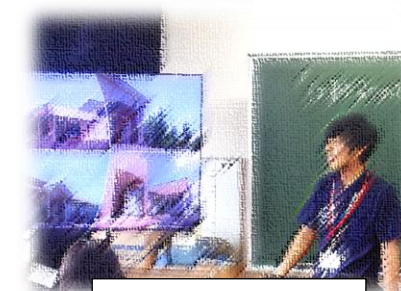
職場体験学習講話