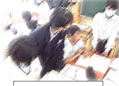
異学年学び合い学習