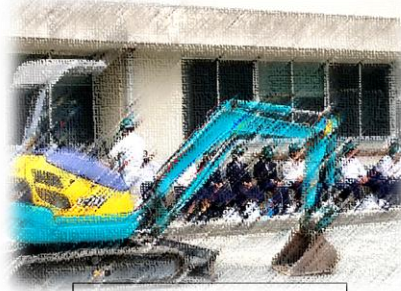
祐誠高校体験入学