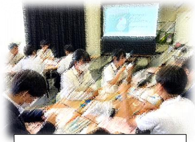
久留米学園高校出前授業