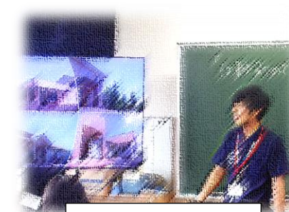
職場体験学習講話