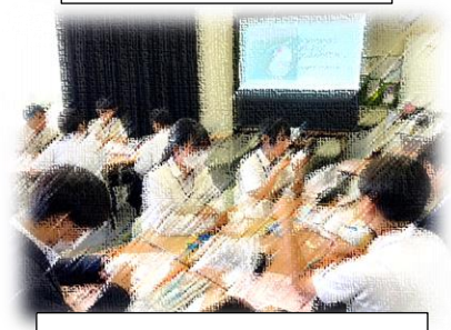
久留米学園高校出前授業