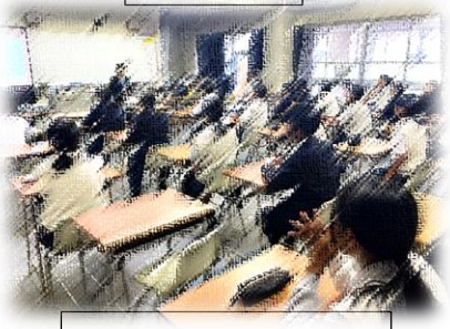
常葉高校出前授業