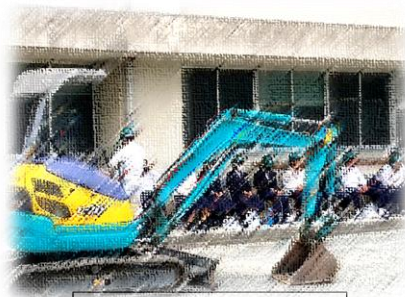
祐誠高校体験入学