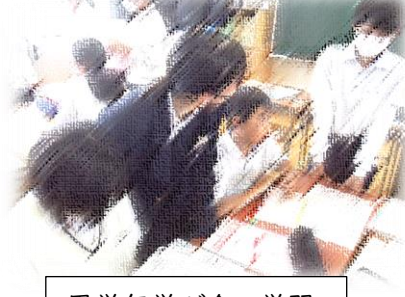
異学年学び合い学習